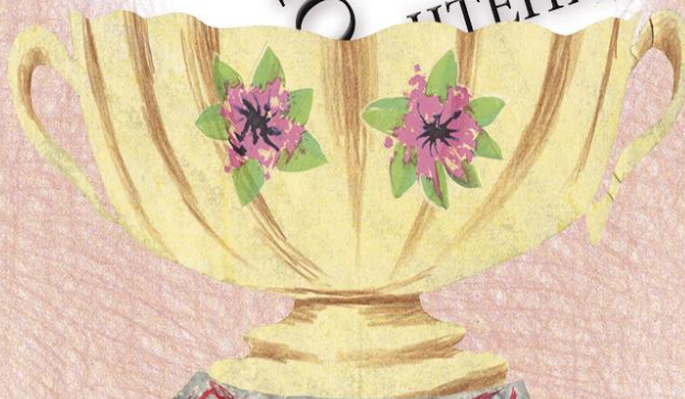
Illustration: Damijan Stepanc, design: Melita Fak

Сэтгэгдэл 书 LASIJUMS KNJIGA 画像 BIBLIO PAROLE BÖCKER ቅጥቶች תּוּנוּמַת 本 독서 ЧТЕНИЕ